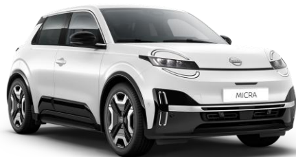
Hófehér* 369 – 0 Ft