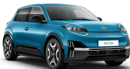
Boldogsággék RCN – 160 000 Ft