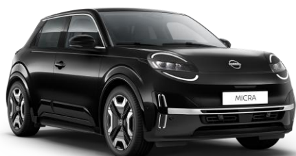
Misztikusfekete* GNE – 160 000 Ft