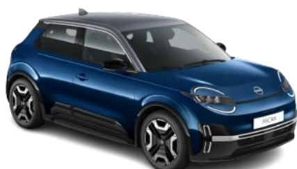
Tengerészkék / Szürke tető YWZ – 300 000 Ft

*ENGAGE felszereltség a csillaggal megjelölt színekben érhető el.