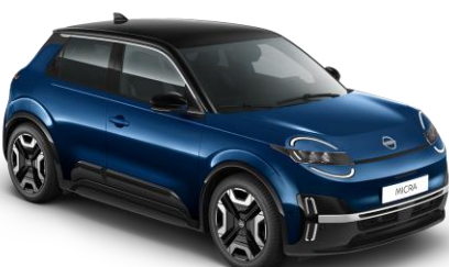
Tengerészkék / Fekete tető YWW – 300 000 Ft