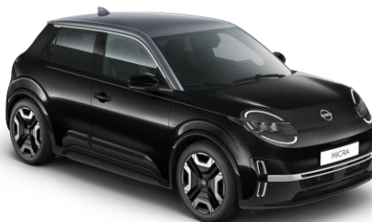
Misztikusfekete / Szürke tető YWX – 300 000 Ft