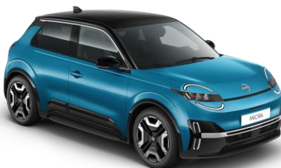
Boldogsággék / Fekete tető YZF – 300 000 Ft