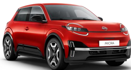
Lázadóvörös NPT – 160 000 Ft