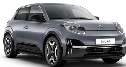
Elegánszüst* KQG – 160 000 Ft