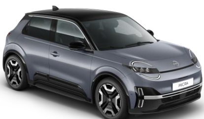
Elegánszüst / Fekete tető YUY – 300 000 Ft