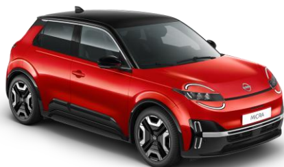
Lázadóvörös / Fekete tető YZA – 300 000 Ft