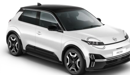
Hófehér / Fekete tető XUF – 300 000 Ft