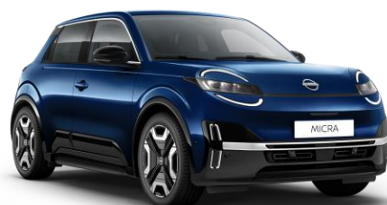
Tengerészkék RRE – 160 000 Ft